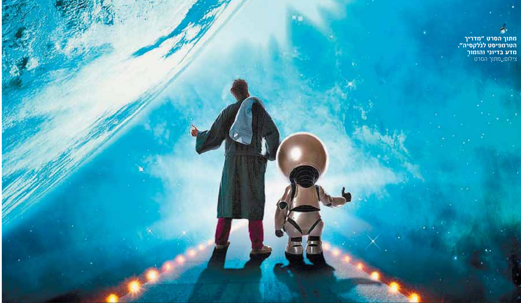
היקום של דאגלס אדמס